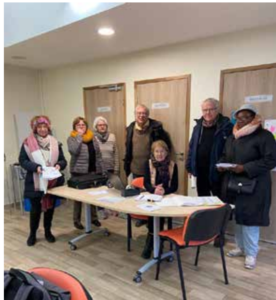
Bibliothèque de Savigné

Les trois bénévoles rencontrés à la bibliothèque municipale de Savigné expriment un besoin urgent d'agrandissement de celle-ci au vu du nombre important de visiteurs (350 de Savigné plus 150 de l'extérieur) et des multiples activités qui nécessitent des lieux dédiés (lecture, jeux, rencontres, chorale, groupes scolaires, accueil des jeunes du foyer d'handicapés d'Ambillou, animations à la journée ou le soir...). Les demandes sont supérieures aux possibilités d'accueil (50 personnes maximum).